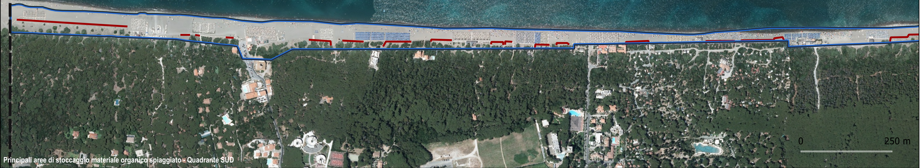
Principali aree di stoccaggio materiale organico spiaggiato - Quadrante SUD