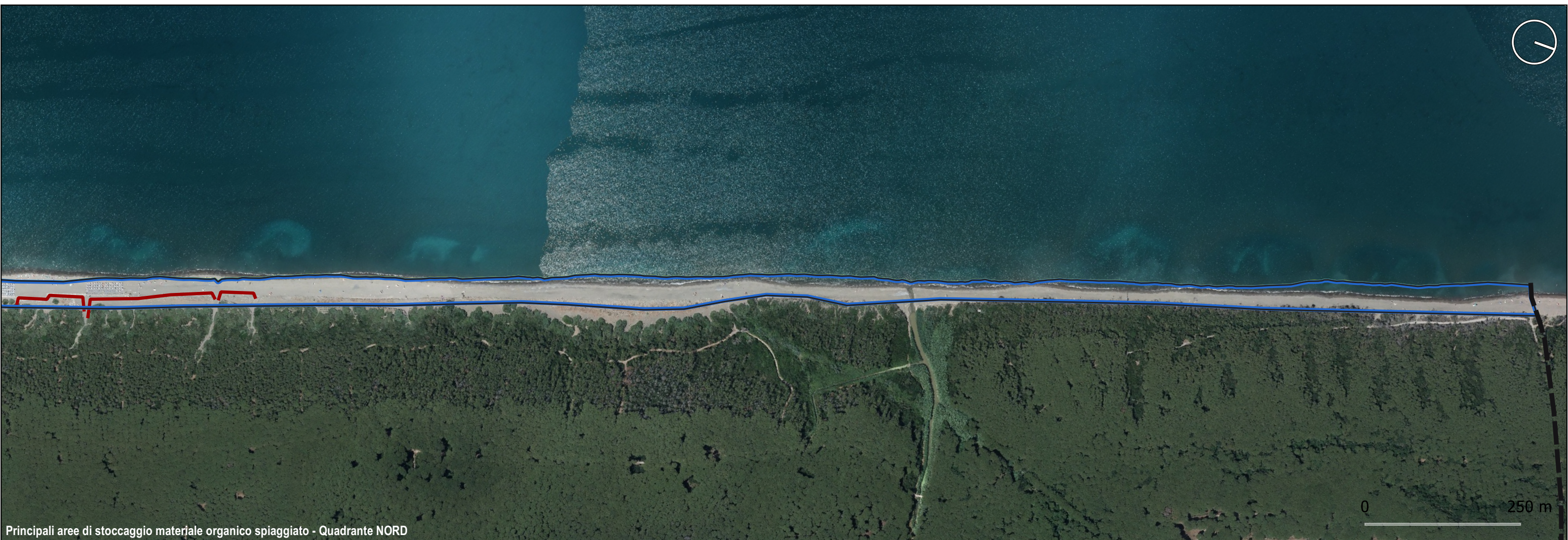
Principali aree di stoccaggio materiale organico spiaggiato - Quadrante NORD