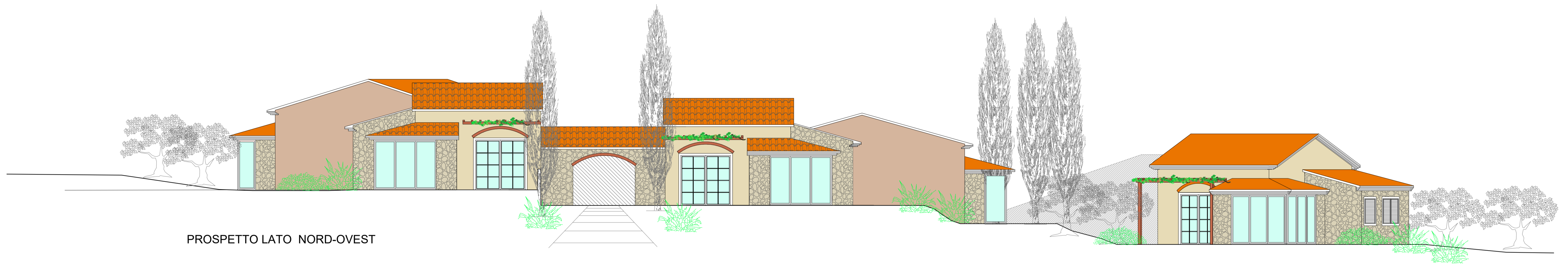
PROSPETTO LATO NORD-OVEST