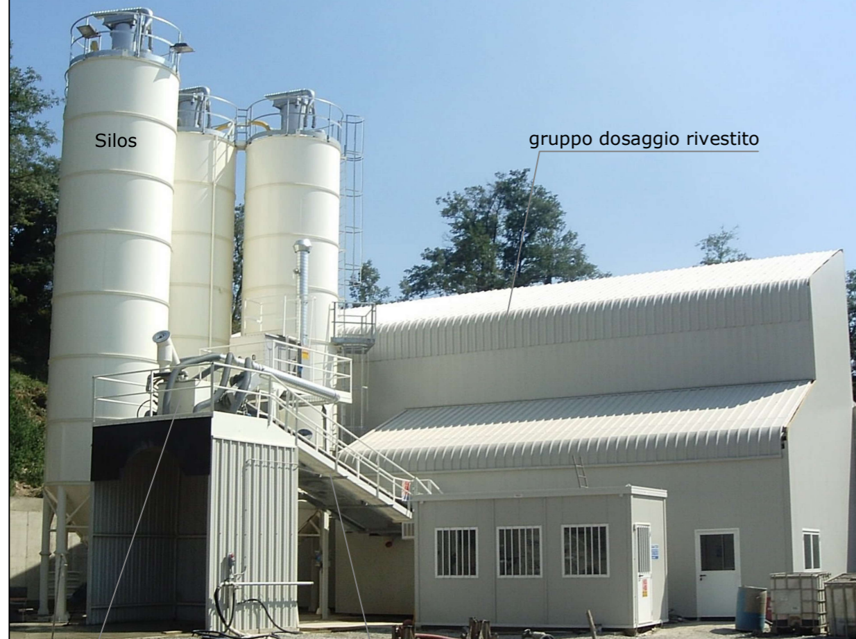
Immagine di Esempio dell'impianto oggetto di intervento (MOD. TB6.36 DRY) e rivestito con pannelli e lamiere