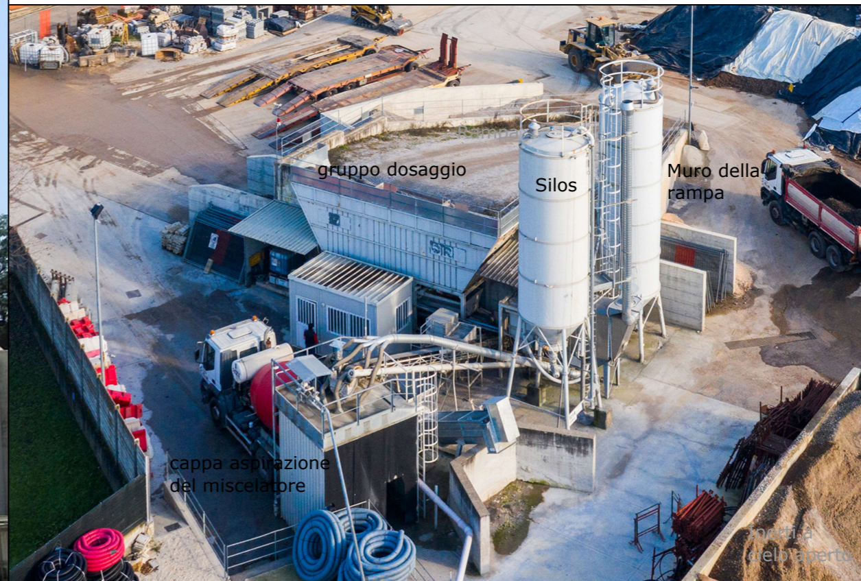
Prospettiva a volo d'uccello e a solo titolo di esempio di un piazzale con piccolo impianto