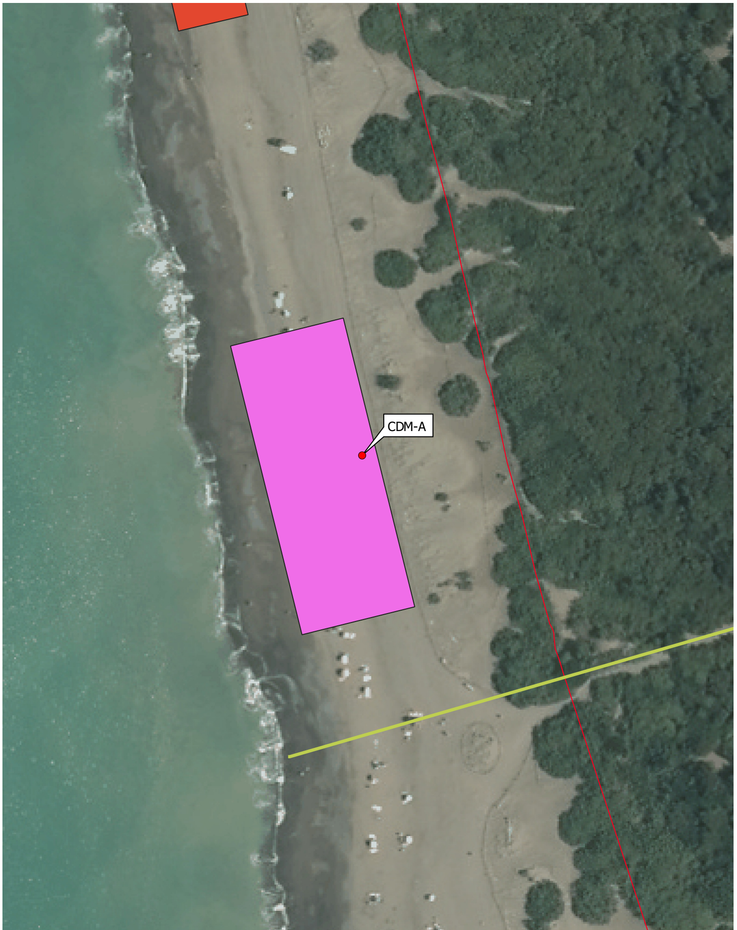
ORTOFOTO DELLA CONCESSIONE CDM-A