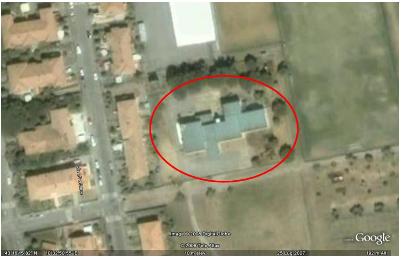
Fig. 1 ó vista dall'alto