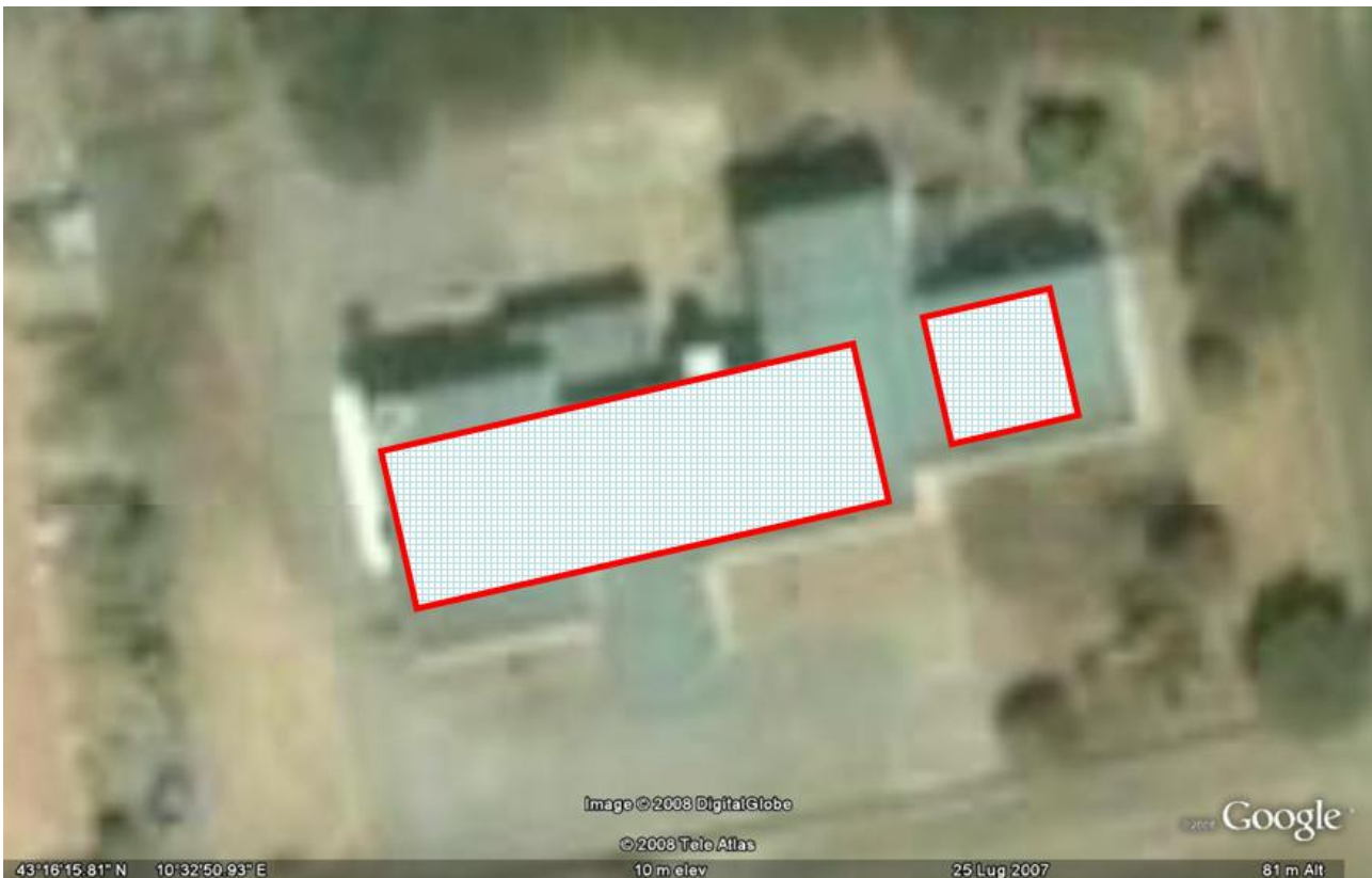
Fig. 2 ó ipotesi posizione impianto fotovoltaico